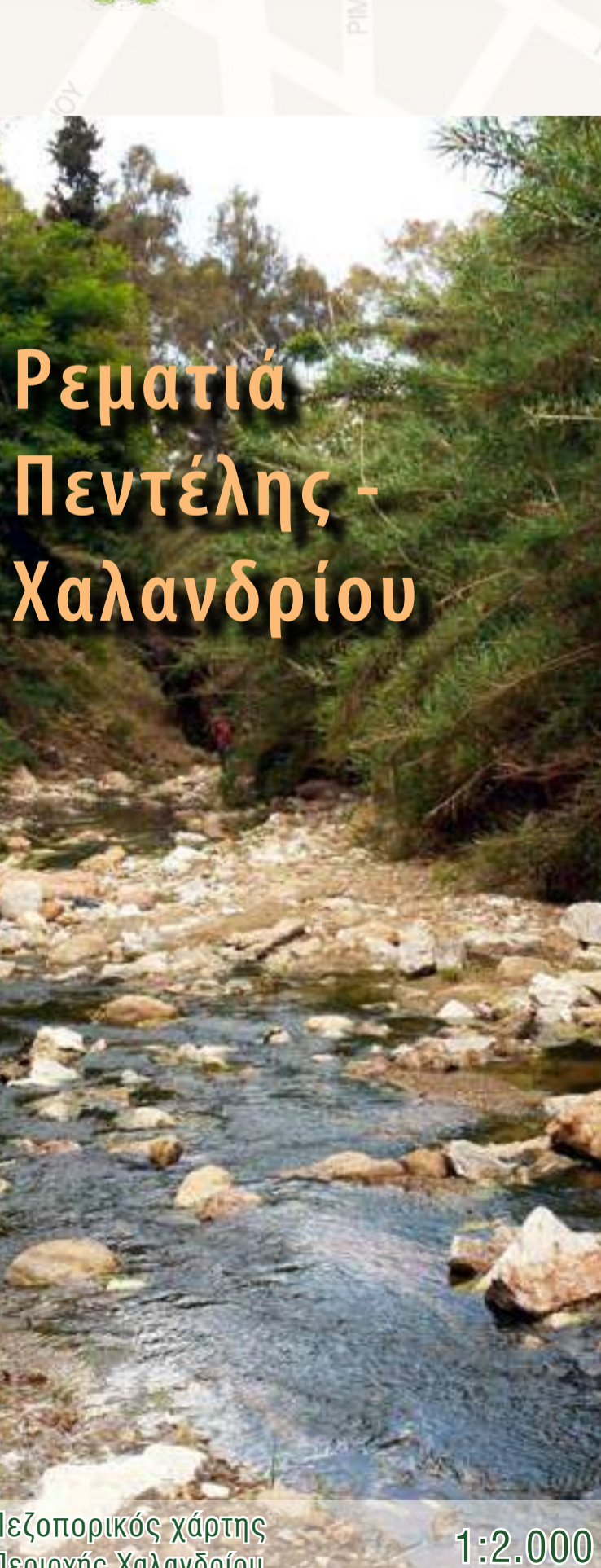
Πεζοπορικός χάρτης Περιοχής Χαλανδρίου 1:2.000

Την κατασκευή των μονοπατιών με GPS έκανε ο Μιχάλης Αντώνης και τους χάρτες συνέθεσε η Πηνελόπη Μαρτσόκα / εκδόσεις ΑΝΑΒΑΣΗΣ Ο Χάρτης βρέθηκε σε σχέση με τη διεύθυνση ή εκδοτική ΑΝΑΒΑΣΗΣ (2024) Προϊόντος: Κ. Καραλής Διεύθυνση: Κ. Καραλής Τηλέφωνο: 210-6820623, 210-6932-61627 E-mail: sormatia@gmail.com Facebook: sormatia Blog: sormatia.blogspot.gr