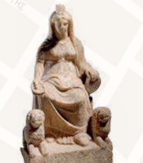
Αγαλαγμάτιο της θεάς Κυβέλης, 2ος αι. μ.Χ. Los Angeles County Museum of Art